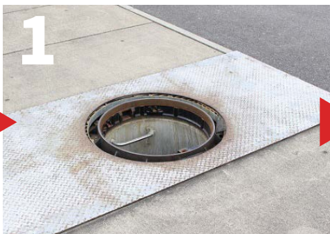
1 マンホールの蓋を外す