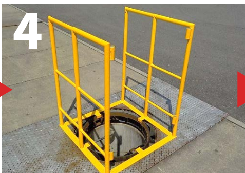
4 クロス柵をボルトで4カ所を固定