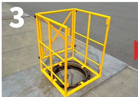
3 柵①、柵②を土台に立てる