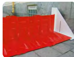
▲サイドアタッチメント