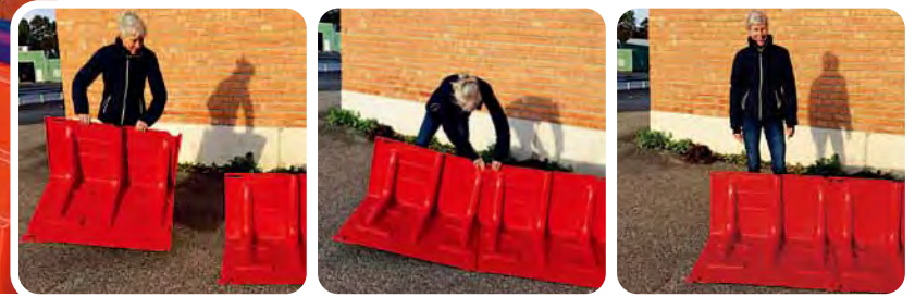
▲設置は、ボックスウォールを背後から見て左から右に並べる

Boxwallは特殊な工具やスキルを必要とせず設置ができ、ユニットのジョイント部(▼印)をつなぐことができます。各ジョイント部は±3度の調節ができ、カーブした設置場所でも対応可能です。