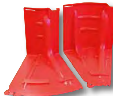
アウトコーナー(左)インコーナー(右)▶