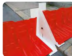
▲段差対応アタッチメント